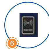
6 Khu vực quét thẻ Card reader