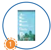
1 Màn hình LCD cảm ứng 32 inch 32" LCD Touch screen

Khối lượng tịnh: 370 kg Net Weight: 370 kg