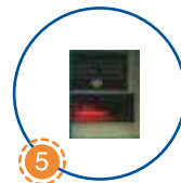
5 Khe đựng tiền/ trả tiền dư Cash slot