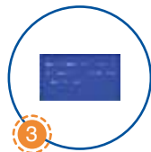
3 Màn hình kỹ thuật Monitor screen