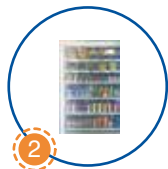
2 Khu trưng bày sản phẩm Product shelves